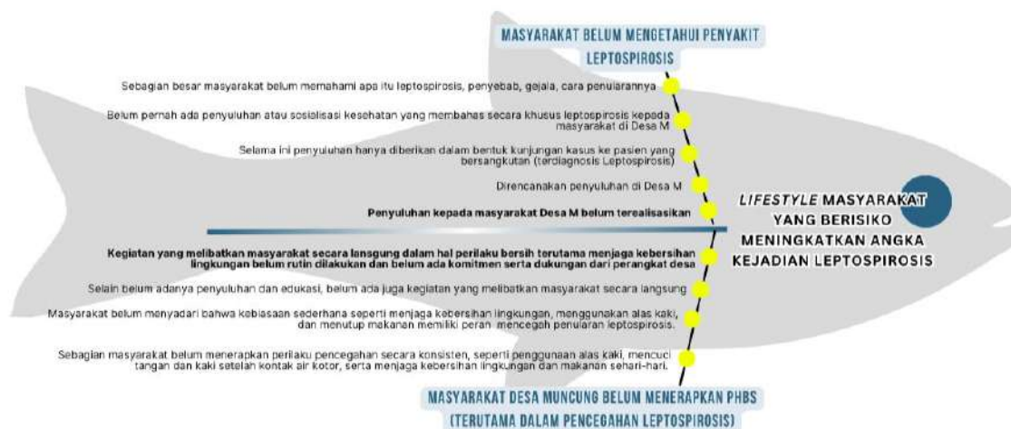
Gambar 4. Diagram Fishbone

Hasil analisis menunjukkan bahwa akar masalah utama pada aspek pengetahuan dan perilaku adalah belum terlaksananya edukasi kesehatan leptospirosis dan kegiatan berbasis masyarakat belum dilakukan secara rutin. Berdasarkan hasil temuan tersebut dilakukan penentuan alternatif jalan keluar dan beberapa diantaranya dituangkan dalam bentuk intervensi yaitu penyuluhan kesehatan kepada masyarakat terkait leptospirosis dan kegiatan gotong royong rutin membersihkan lingkungan disertai komunikasi dan koordinasi antara puskesmas dan perangkat desa setempat.