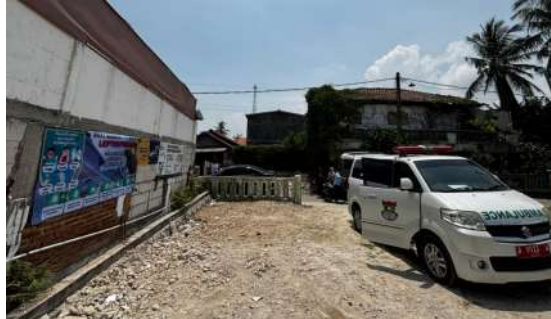
Gambar 5. Spanduk edukasi terpasang di tempat umum

Selama pelaksanaan terdapat beberapa kendala seperti proyektor yang kurang jelas karena di tempat penyuluhan terbuka sehingga cahaya matahari terlalu terang, diatasi dengan penambahan penggunaan media edukasi lain seperti poster dan leaflet . Beberapa peserta juga tampak kesulitan membaca dan menulis lembar tes (ada beberapa tidak dapat baca tulis) sehingga memerlukan pendampingan dari tim di lapangan dengan membacakan pertanyaan. Waktu kegiatan juga mengalami keterlambatan 15 menit karena menunggu sebagian besar peserta hadir. Alat kebersihan yang digunakan juga sangat terbatas sehingga tidak semua area dapat dibersihkan.