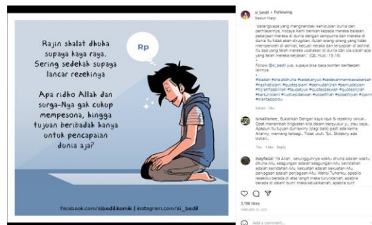
Gambar 5. Postingan Pesan Dakwah Syari’ah Ibadah

Dalam lingkup ibadah meliputi hubungan manusia dengan Allah contohnya seperti shalat, zakat, puasa, berdo’a dan berdzikir. Sebagaimana halnya dengan postingan akun si_bedil pada 25 febuari 2021. Postingan dengan jumlah penyuka sebanyak 3.196 ini, mengandung pesan ibadah. Pesan ibadah yang terkandung dalam postingan ini adalah mengingatkan untuk memperbaiki niat kita ketika akan melaksanakan ibadah, dalam hal ini shalat dhuha. Disini komikus mengingatkan kita bahwa jangan hanya beribadah dengan niat dunia saja. Komikus juga memberikan disertai ayat al-qur’an caption guna mepertegas pesan dalam postingan.