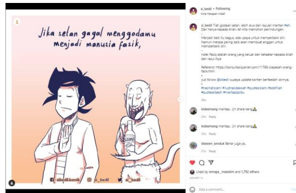
Gambar 2. Postingan Pesan Dakwah Aqidah Ruhaniyat

Didalam postingan ini terdapat pesan bahwa kita harus percaya akan adanya setan yang akan terus senantiasa berusaha merayu ubtuk menjerumuskan kita pada kesalahan. Jika setan gagal menejerumuskan kita menjadi orang fasik (orang yang keluar dari ketaatan kepada Allah) maka setan akan menggoda manusia agar merasa menjadi manusia yang paling baik juga disertai caption yang menarik sebagai penjelaras.