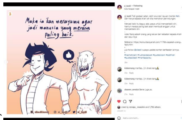
Gambar 3. Postingan Pesan Dakwah Aqidah Ruhaniyat