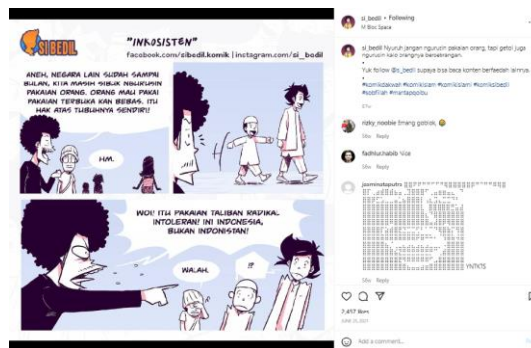
Gambar 7. Postingan Pesan Dakwah Akhlak

Akhlak merupakan sifat dalam diri manusia yang muncul berupa perilaku atau perbuatan dengan spontan tanpa banyak pertimbangan terlebih dahulu. Pada postingan akun si_bedil 25 Juni 2021 dengan jumlah penyuka mencapai 2.457 ini, mengandung pesan akhlak di dalamnya. Dalam postingan tersebut menyinggung orang yang memiliki sifat yang tidak konsisten dan mudah menyalahkan orang lain. Komikus bermaksud agar kita menginstropeksi diri dan tidak bersifat seperti yang ter dapat pada postingan.