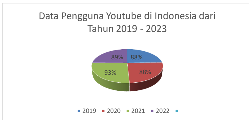
Gambar 1. Data Pengguna Youtube di Indonesia dari Tahun 2019-2023

Di Indonesia sendiri dalam kurun waktu lima tahun terakhir, terhitung sejak 2019 hingga 2023 para pengguna YouTube setiap tahunnya terus bertambah, hal ini dibuktikan dengan data yang dikeluarkan oleh We Are Social melalui laman resminya.