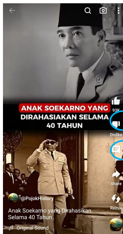
Gambar 2 dan 3. Konten pada Media Sosial

Berdasarkan hasil pada gambar 2 dan gambar 3 , konten dengan judul "Anak Soekarno yang Dirahasiakan Selama 40 Tahun" mencapai jumlah penonton sebanyak 6.9 juta dengan jumlah like sebanyak 93 Ribu. Hal tersebut membuktikan bahwa penyebaran informasi melalui YouTube Shorts pada akun Pojok History berhasil mencuri perhatian publik, dan informasi yang disampaikan dapat diterima dengan baik oleh masyarakat. Selain itu penyebaran informasi melalui YouTube Shorts pada akun Pojok History juga dapat menciptakan interaksi dari penonton, hal itu dibuktikan dengan jumlah komentar pada konten "Anak Soekarno yang Dirahasiakan Selama 40 Tahun" yang berhasil menembus diangka 3.3 ribu serta berhasil menciptakan komentar pro dan kontra terhadap substansi konten yang ditayangkan.