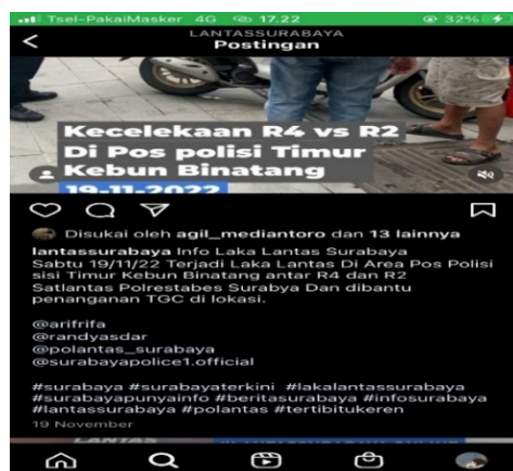
Gambar 1.4 Unggahan tanggal 19 November 2022

Peneliti melihat pada gambar 1.3 menunjukkan adanya keterangan informasi berdasarkan lokasi peristiwa, diperkuat dengan keterangan pada unggahan yaitu "JL.Urip Sumoharjo." Yang menunjukkan bahwa kecelakaan terjadi di JL.Urip Sumoharjo, peneliti juga menemukan adanya penjelasan lebih lanjut mengenai kejadian melalui gambar serta keterangan " Diinformasikan korban meninggal dunia akibat serangan jantung di JL.Urip Sumoharjo."