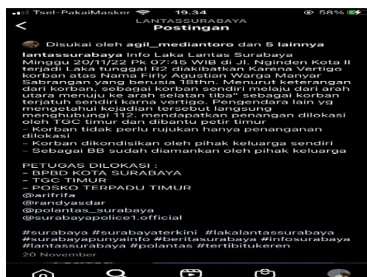
Gambar 1.7 Unggahan tanggal 20 November 2022

Kategori ini ditentukan karena adanya penyampaian informasi melalui caption atau keterangan dikonten @lantassurabaya menggunakan unsur keterangan dari korban, yaitu adanya kalimat "Menurut keterangan dari korban sebagai korban sendiri", yang menunjukkan adanya informasi yang didapatkan terpercaya karena berdasarkan dari korban atau sumber akurat, tepatnya pada kejadian yang dialami korban.