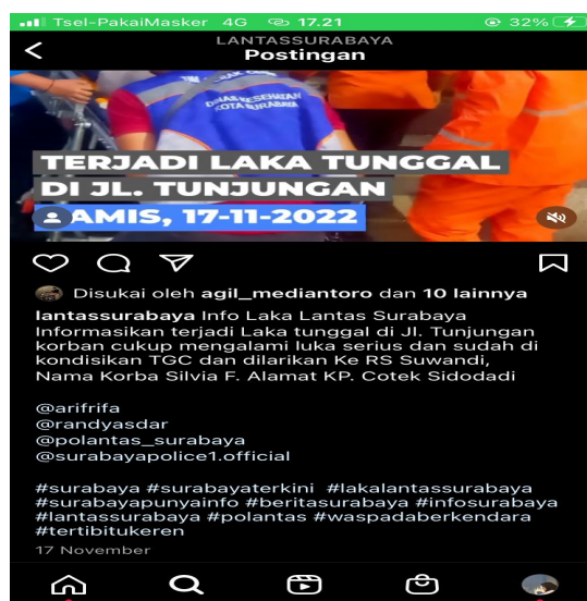
Gambar 1.1 Unggahan tanggal 17 November 2022

Kategori ini ditentukan karena adanya penyampaian informasi melalui caption atau keterangan dikonten @lantassurabaya. Terdapat nama jalan dan detail lokasi peristiwa, yaitu adanya kalimat "Laka tunggal di Jl. Tunjungan, Laka Lintas di JL.A.Yani arah ke selatan, di JL.Urip Sumoharjo, Laka Lintas di area pos polisi sisi timur kebun binatang, area JL.Gunungsari jembatan depan Rolag terjadi laka lintas tunggal". Terdapat 5 unggahan dengan unsur kategori lokasi peristiwa.