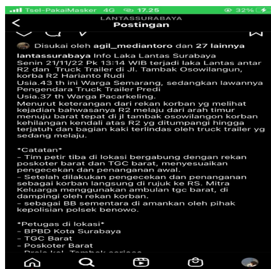
Gambar 1.6 Unggahan tanggal 21 November 2022

Kategori ini ditentukan karena adanya penyampaian informasi melalui caption atau keterangan dikonten @lantassurabaya menggunakan unsur keterangan dari orang lain, yaitu adanya kalimat "Menurut keterangan dari rekan korban yang melihat kejadian", yang menunjukkan bahwa informasi tersebut didapatkan dari keterangan orang lain. Sehingga informasi yang didapatkan dapat berperan sebagai penunjang informasi. Terdapat 1 unggahan dengan unsur kategori keterangan orang lain.