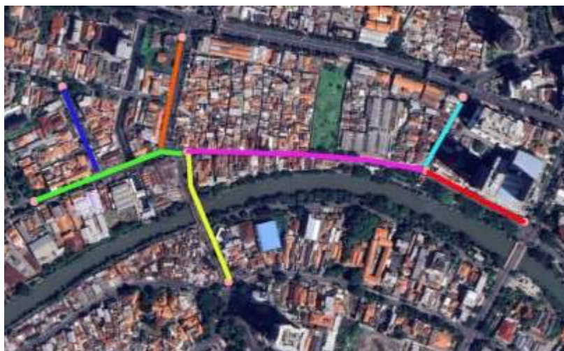
Gambar 1 . Titik Koordinat Segmen Penelitian Jalan